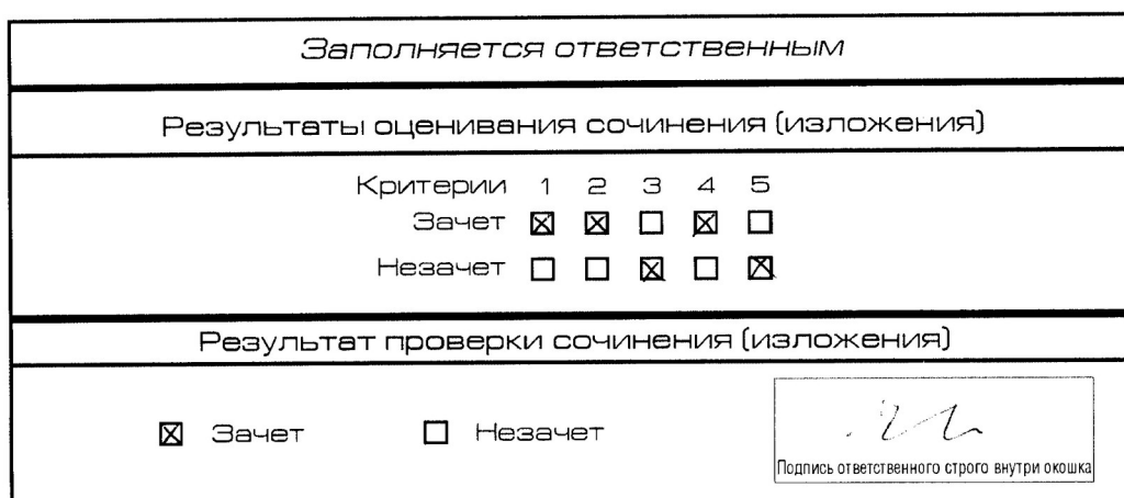
Рис. 5. Область для оценки работы.

Для каждого критерия должно быть помечено только одно поле – либо «Зачет» либо «Незачет».